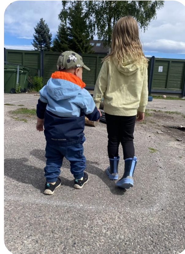
Ei trygg hånd på lekeklassen

Personalet er autoritative. I BMB vil det si at personalet har trygge grenser og rammer, og mye kjærlighet for barna. Vi er tydelige, men varme når vi veileder hverandre, og barn.