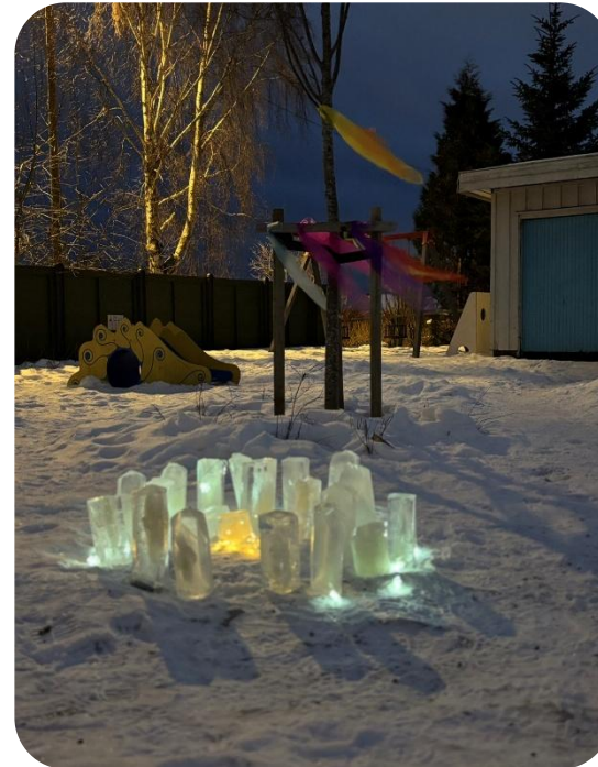
Erfaringer med vann i ulike former

I Holmestrand kommune har vi ambulerende spesialpedagoger som har arbeidssted i flere barnehager, også i BMB. Spesialpedagogisk hjelp foregår i fellesskap på barnets avdeling, og alltid i gruppe.