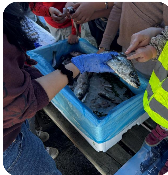
Erfaring med råvarer