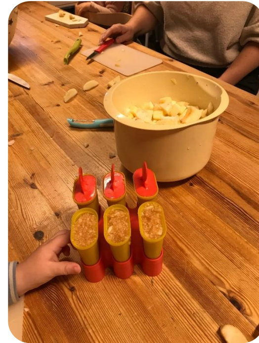
Eple-is laget av epler fra barnas hager

Matjungelen er et ledd i oppfølging av nasjonal handlingsplan for bedre kosthold. Hensikten er å gi barn en matglad hverdag og fremtid. BMB deltar i prosjektet fra 2024.