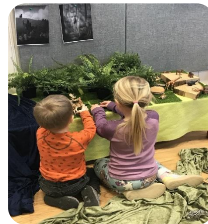
Høytlesning med lekestund

Vi har gjennom flere år i barnehagen jobbet med ulike typer prosjekter på tvers av avdelingene. Dette er en metode vi synes er spennende og givende å jobbe med. På slutten av hvert barnehageår har vi en idemyldring, hvor også barn og foreldre har blitt involvert og hvor vi ut ifra dette bestemmer neste års overordnede tema. Det kan være noe barna har vist stor interesse for mot slutten av året, foreldre kan ha kommet med forslag de synes kunne vært interessant eller vi i personalet har sett noe eller blitt inspirert av andre.