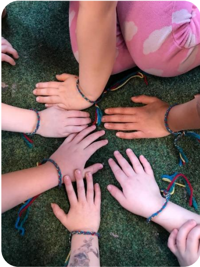
Armbånd for barnehagevenner